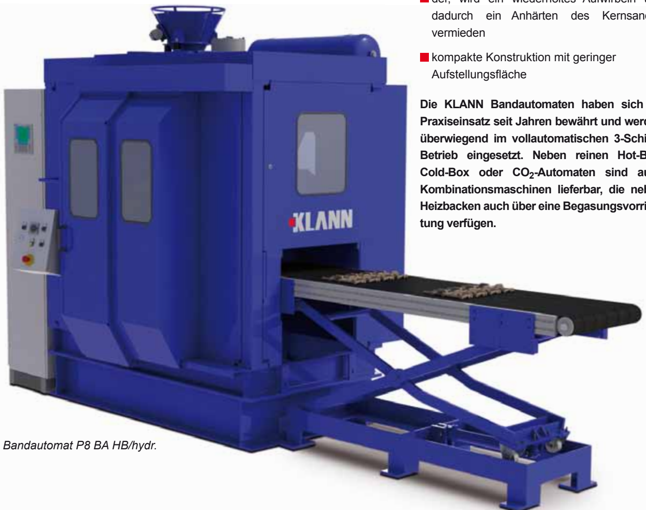
Bandautomat P8 BA HB/hydr.

Die KLANN Bandautomaten haben sich im Praxiseinsatz seit Jahren bewährt und werden überwiegend im vollautomatischen 3-Schicht Betrieb eingesetzt. Neben reinen Hot-Box, Cold-Box oder CO 2 -Automaten sind auch Kombinationsmaschinen lieferbar, die neben Heizbacken auch über eine Begasungsvorrichtung verfügen.