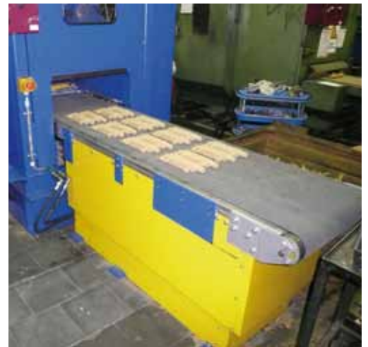
Kernaustrag auf Transportband